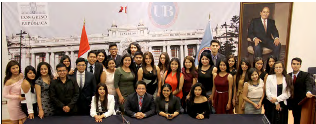
Los estudiantes alternaron con congresistas respecto al uso de las redes sociales.

Como una forma de conocer en directo como funciona todo lo relacionado a las Relaciones Públicas e intercambiar puntos de vista con algunas de sus autoridades, estudiantes del séptimo ciclo de nuestra Universidad organizaron el Conversatorio “Comunicación