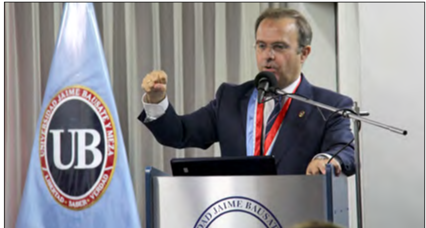
Personalidades del periodismo peruano asistieron a la ceremonia.

Refiriéndose a nuestra casa de estudios expresó que Bausate tiene mucho prestigio en el Perú y en el extranjero por lo que consideró un privilegio el haber recibido el Honoris Causa. El Dr.