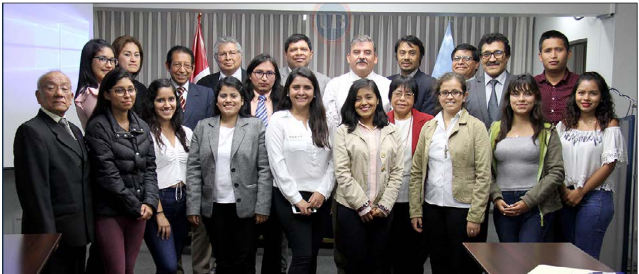
El grupo de investigación de la UB que tuvo a su cargo la presentación de los proyectos.

Primeros avances fueron presentados por profesores y alumnos en la I Jornada